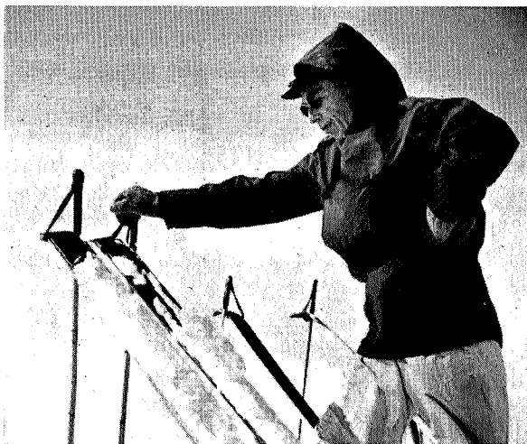
«Åssen skal dætta gå?»

Seinere går jeg i detaljer. Da nytter jeg båt. Det er et godt fram-komstmiddel på Sula og ingen mangel på det. Jeg rror ført til Andholmen og så til Skarvklovingen . Men det jeg opplever der av utenkelig frodighet, skjønnhet, ynde og villskap, — — det er en historie så lang at jeg må forbeholde meg retten til noen sider i årboka også neste år.