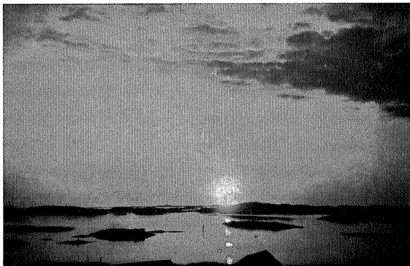
Sol går i hav bak Froøyene