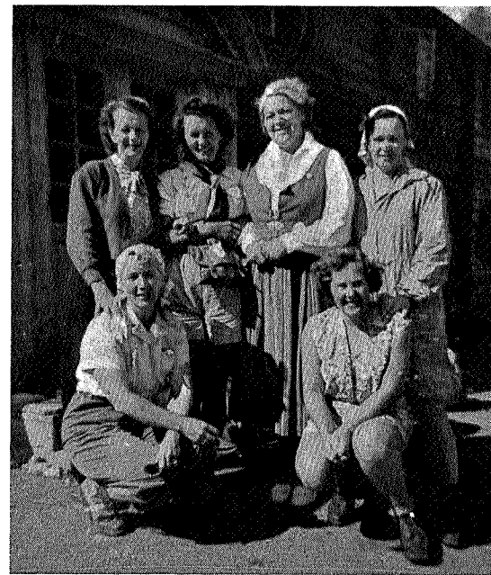
Syforeningen på Nedalen

Å bli ønsket velkommen på Nedalshytta, det betyr bare én ting — du er hjemme med en gang. Og så samles vi med andre fjellvandrere rundt peisen om kvelden, som en eneste stor, hyggelig familie.