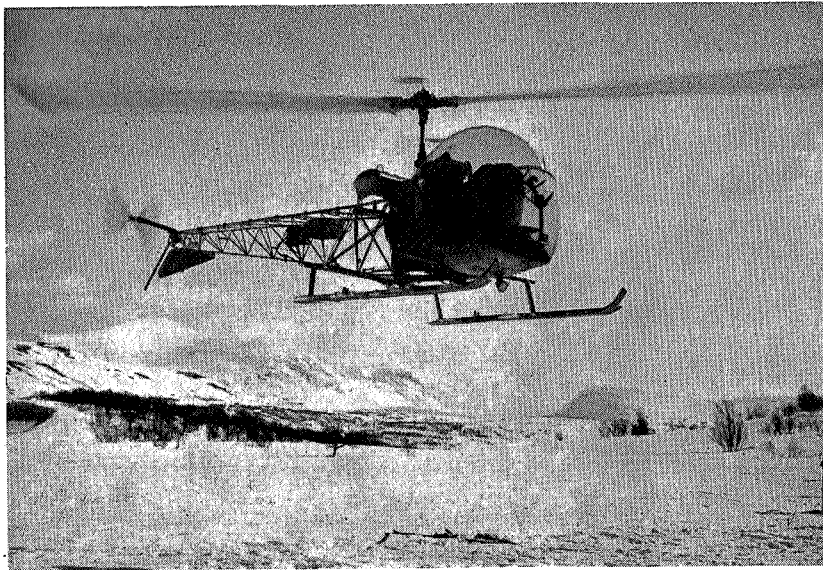
Syketransport fra Nedalen, påskedag 1952

Det er en betryggelse å vite at slike transportmidler nå er tilgjengelige.