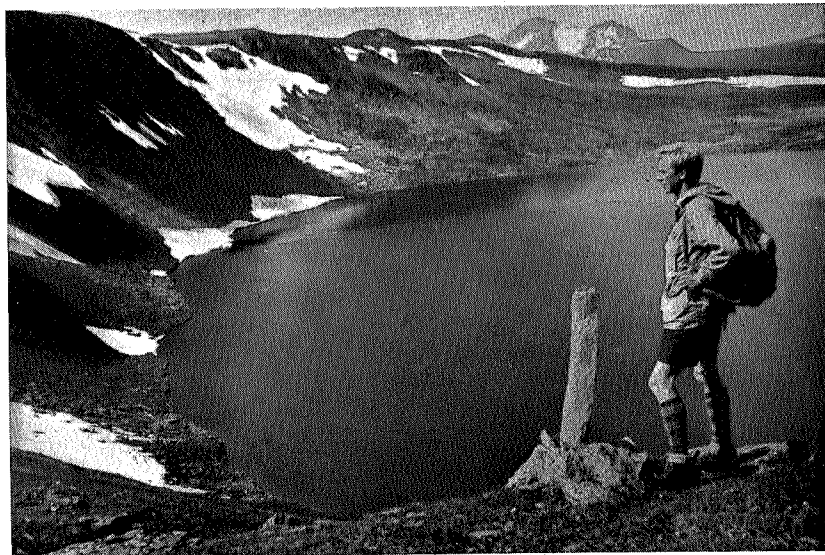
Fossdalstjern i Trollheimen