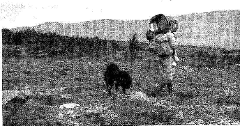
Lett på foten med tung bør