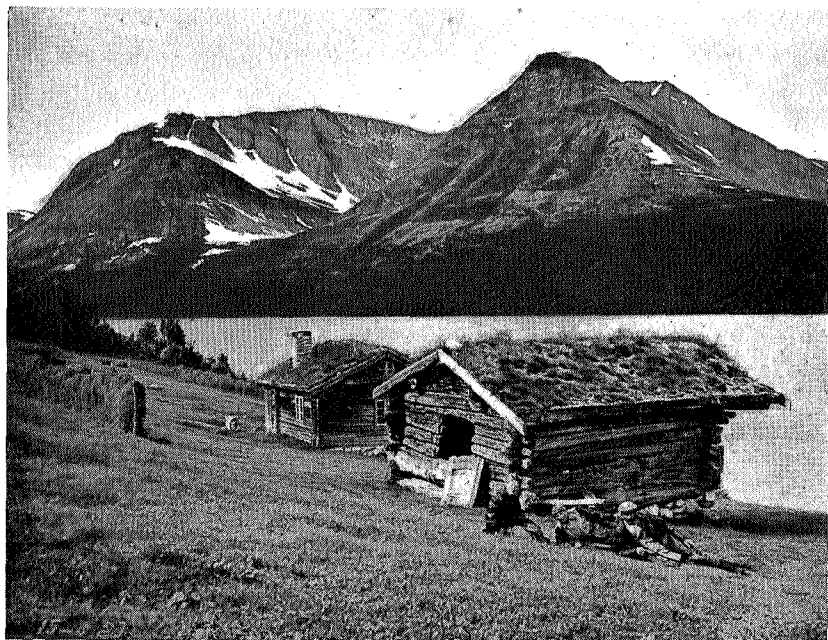
Midtre- og Indre Gjevilvasskam