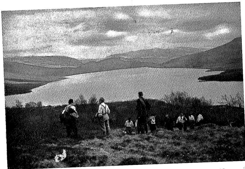
Gjevilvatnet fra Hammeren