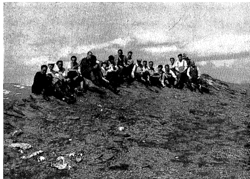
Sangerbrødre på fjellferd — Tyrikvamfjell

Så er det, det sker, det underlige, det vidunderlige! Du er pludselig ikke træt mere. Du ser opad. Nå, der er jo ikke så langt op til toppen. Det kan højest ta en halv time at nå derop. Du har hidtil gået og set ned, men uden at se noget. Nu opdager du blomster, som du aldrig før har kendt. Her er forresten mange. Du