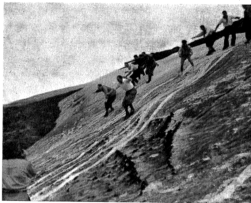
St. Hans-løyer på Tyrikvamfjellet

— — Du er ikke i fjeldet mere. Du sidder hjemme og fortæller din familie om dine bedrifter. Og du lever i lykkelig uvidenhed om tåge, regn, kulde og snestorm i fjeldet. Dine sko ser ikke nye ud mere, og dit tøj har været til rensning. Men i din lomme fandt du en lille kvist av bjergbirken. Jo, skønt vissen duftede den endnu. Og du lukkede øjnene og så. Så Blåhøs korkagtige hinde, Kammenes uvirkelige sne, så Okla spejle sig i søen. Og du forstod, at det ikke var sidste gang, ja, at du ikke endnu havde været — i fjeldet.