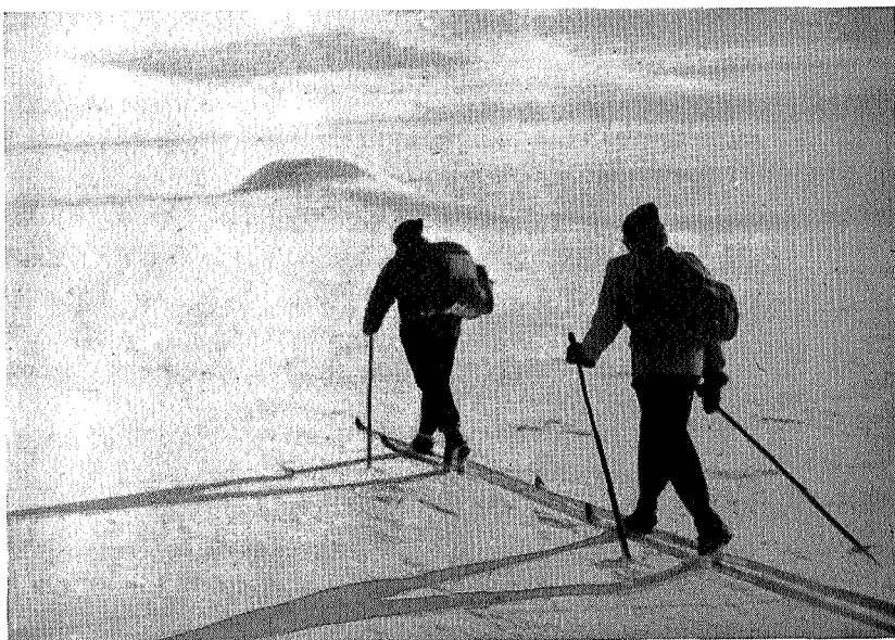
Mot Vardeberget på strykende vårføre