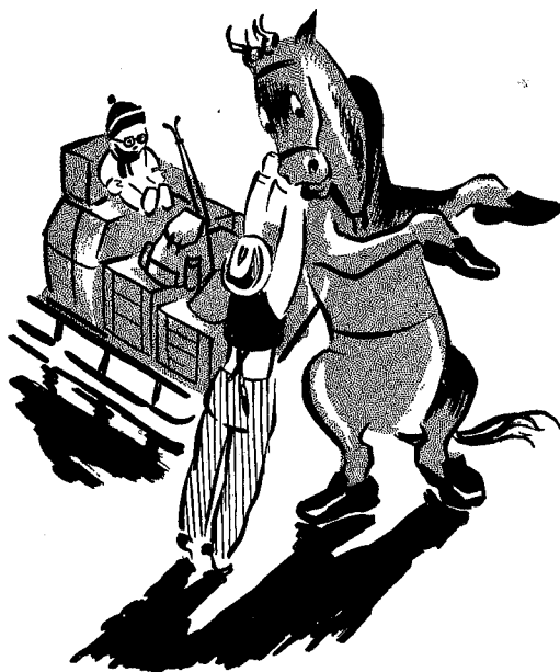
da måtte hesten bruke kalosjer

og kjelken skikjelken altså hadde reist lenge før oss men heldigvis nådde vi igjen dem akkurat på den stasjonen der vi skulle av men vi var nok ordentlig uheldige likevel for mens far holdt på å samle sammen alle de der tingene gikk toget videre så vi måtte få kjørt hele greia opp til hytta med hest og slede men det syntes jeg var ordentlig moro for jeg fikk sitte på lasset hele veien og det siste stykket var det så mye snø at da måtte hesten bruke kalosjer forat den ikke skulle synke ned i snøen og bli våt på beina tror jeg det var men noen ganger så det ut som den skulle falle bakover for den stod med armene høyt opp i lufta og sprellet og så begynte den å nyse en skrekkelig masse men så greidde mannen til slutt å hjelpe den ned og da gikk det fint helt til vi kom til hytta