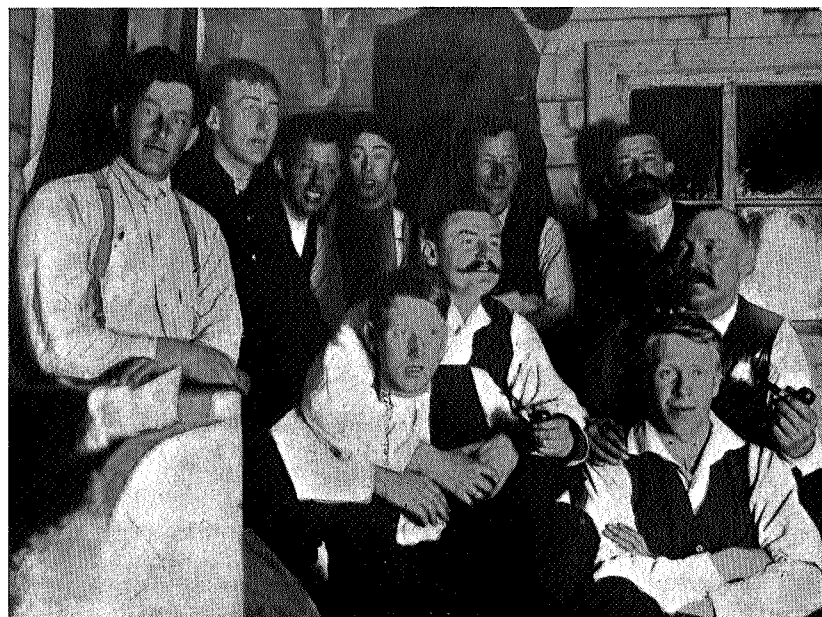
I gammelhytta på Storerikvollen.