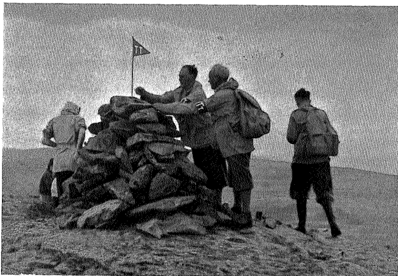
TT-vimpelen plantes på Steinfjellet.