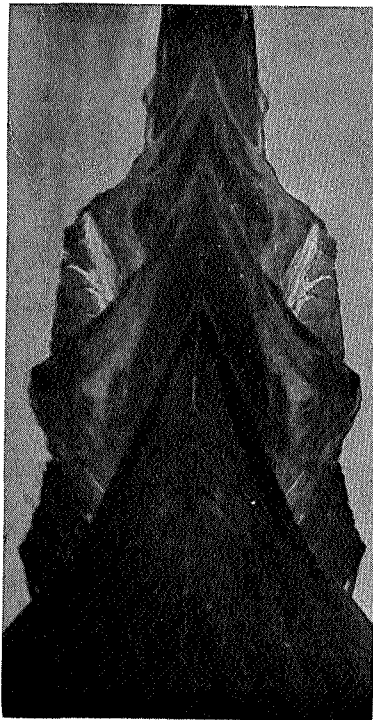
I bønn — eller ..

Hestane kunne trenge ein serleg juleklapp i gamle dagar, da dei laut vera med på så mange slag ferder. Det var ofte slitsam draging av plog og høy og ved og vatn heime på garden, og dryge dagferder på ujamne ridevegar med varefrakt frå byen og med ferdafolk over fjellovergangane.