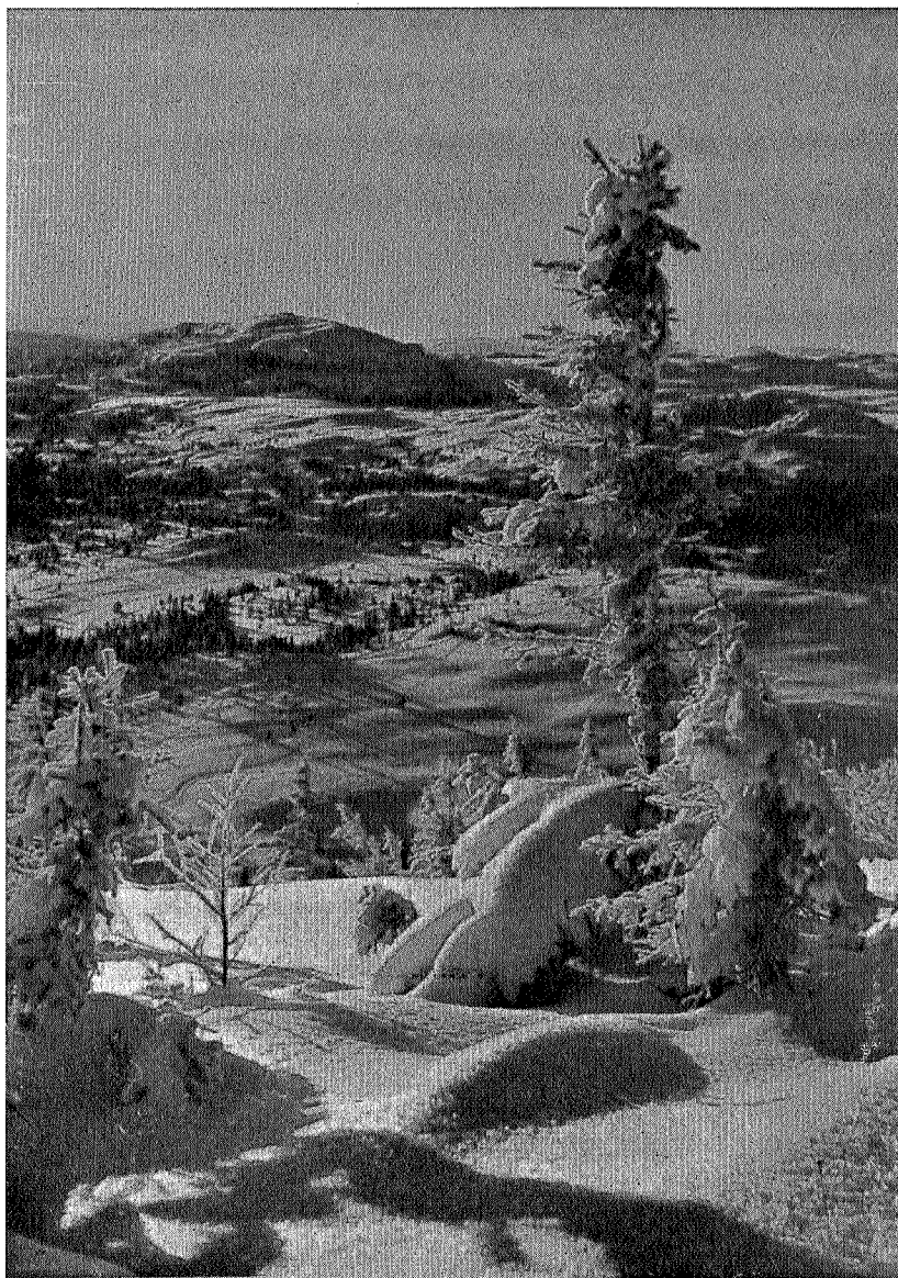
Eventyr fra Bymarka.