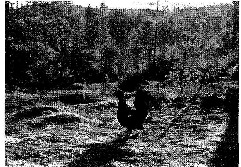
Og så spilte tiuren — — —

Bortom stormyrene, utpå en bratt kant med tjonndrag langt nedom på to sider, stikker det seg fram en måssarabbe med ei vid, stormbrukket furu. Myrkanten går helt inntil rabben. Nedom meg i mørket kan jeg se ett og annet tjonnauge mellom tørrtoppene. Ovom meg har jeg fjellet, mørkt prøyserblått med striper av snø som lyser uvirkelig i natta. Nedover går myrene i hald ned mot tjukkskog. Her er det tiuren spiller. . . . Jeg hadde vært der et par turer mens snøen lå. Da hadde jeg sett spor etter tiurene. De hadde sopet i snøen med vingene, gått fram og tilbake, gjort rundkast og sopet videre. Tørr og lang møkk lå etter dem alle steder. Det kunne vel ha vært en 5—6 stykker, og det så ut som de hadde sine faste standplasser, der det var tett-trampet, men mellom plas-