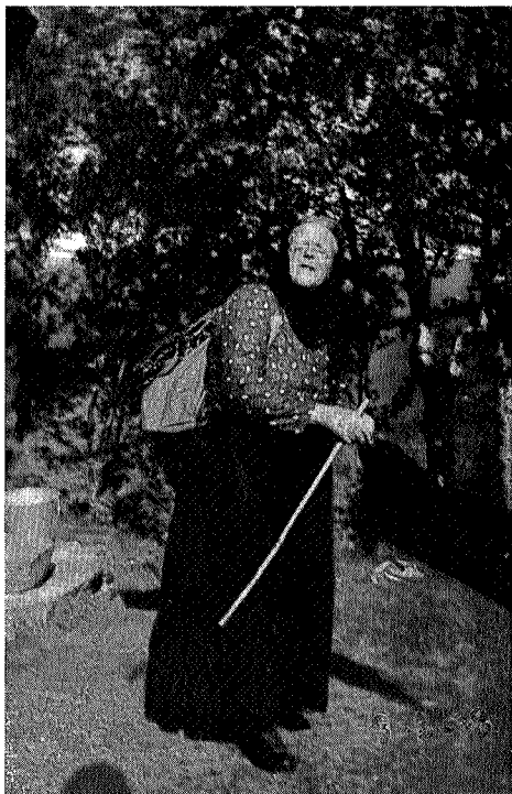
Kjerringa med staven

Neste års arbeide vil bli viet den sørlige del av Sylene.