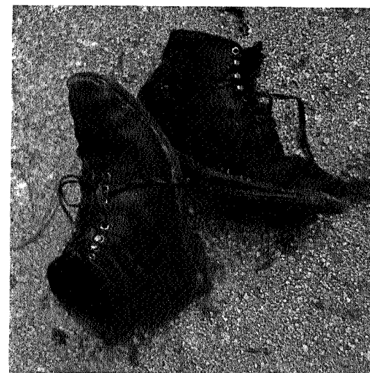
— — — hav takk

Så gjenstod bare å skli slalåm nedover stien til Fale og komme ned akkurat tidsnok til å se bussen som vi skulle med forsvinne oppover mot Opdal.