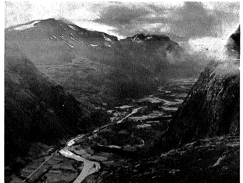
Nedover Sundalen fra Falestupet

Neste Kårvatn. Fremdeles mindre bra vær. (Dårlig vær eksisterer ikke, det blir alltid verre og verre og slutter som uvær). En