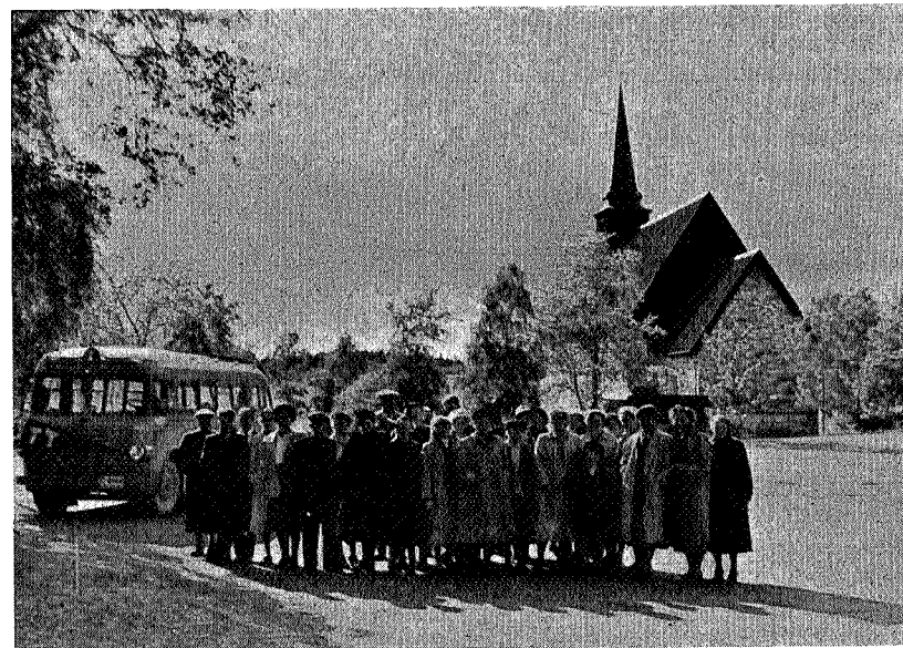
Fellesturen Trondhjemsfjorden rundt. Ved Stiklestad kirke