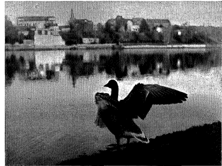
Grågås ved Gangbrua

nordøstover fra Gjevilvasshytta til De er oppe på den første bakkekammen. Her er det lett å komme over Hammerbekken, som lenger nede går i et djupt gjel. Så holder De langs sørsiden av Hammerhø og Svahø. Gå ikke over toppene, men rund fjellfóten. Øst for Svahø vil De oppdage at det går et skar nordover. Her skal De gå og snart vil De finne Langtjønna, som sender vatnet nordover til Grøna i Skardalen. Omtrent midt på Langtjønns østside vil De finne åpningen til Trollkirka. Til sommeren skal vi muligens merke opp letteste vei her forbi og frem tli Skardalen. Etter et besøk i Trollkirka kan De ta ned til Grøna, følge denne vestover til Grøntjønna — hold litt opp fra myrene — og ta på skrå opp til stien fra Jøldalshytta til Gjevilvasshytta. Er De av den riktig spreke sorten, kan De fra Grøntjønna ta oppover ryggen (s-sv.) til toppen av Tyrikvamfjell, plukke med Dem norsk malurt, som det fins mye av her og i skarpt unnarenn ta veien ned til Gjevilvasshytta. Hele turen kan gjøres på 3—4 timer, eksklusive rast. God tur.