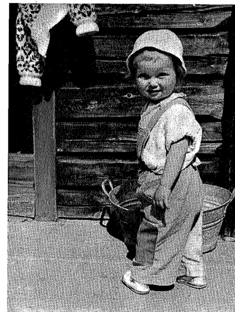
Er det mere som skal vaskes idag?

Været hadde bedret seg betydelig og gjorde turen til litt av en opplevelse. En tur i den arrangerende forenings fjellområde viste seg å slå meget godt an, og vi som fikk gleden ved å delta i turen vil bevare minnet om den som noe av det kjæreste vi eier.