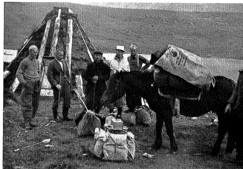
Lappkåte ved Randseren

Fra rasteplassen bar det oppover i steinet terreng, ofte med leire og vassig imellom. Heldigvis varte det ikke lenge før fjellet bød på faste lyngtepper, mens solen brøt igjennom og tørket klærne våre på kroppen. Etter et par timers marsj nådde vi ei tjønn som ble en opplevelse for oss alle sammen. Det var blikkstillta da vi kom dit og vatnet var så klart og rent at vi så botn langt utover, selv om det var mange meter djupt. Store steinblokker så vi langt der nede