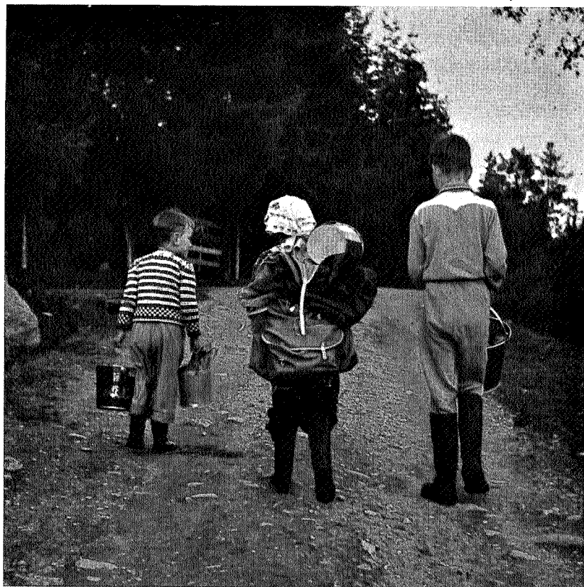
Matauk eller vordende turister?