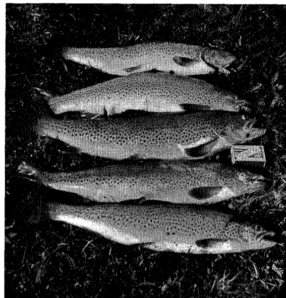
Dagsfangst fra Fremstadvatnet

Praten gikk, myggen var glemt og alt var såre godt. Velværet seg innover oss og tankene gikk tilbake til de herlige dager vi hadde opplevd sammen. Summen av det hele var vi enige om, drømmen som vi hadde drømt så mange ganger var blitt til virkelighet: Børgefjell. — — —