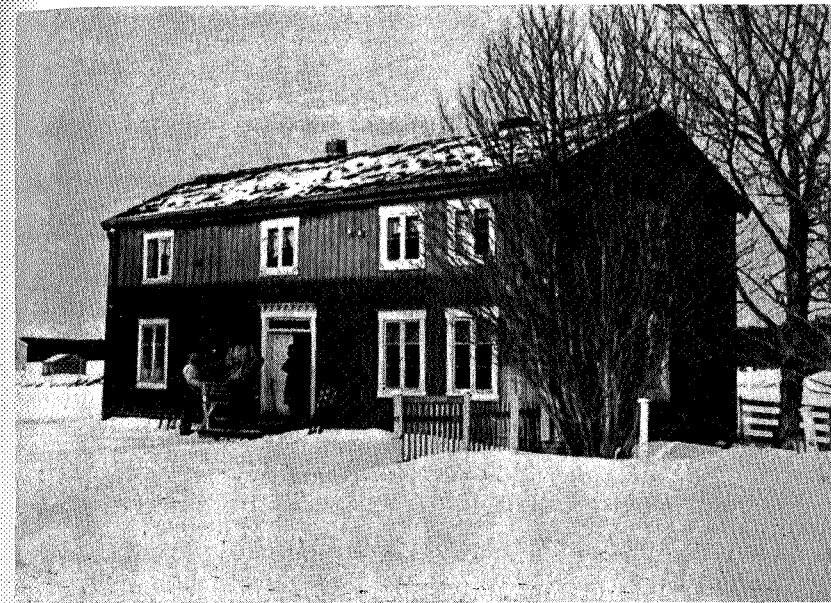
Stordalsvoll — Meråker