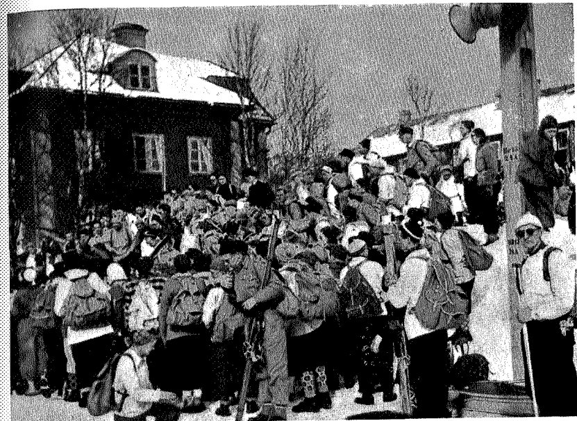
Fellestur til Storlien