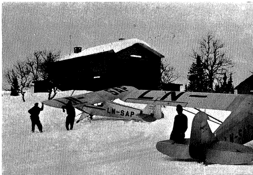
Flybesøk på Schulzhytta