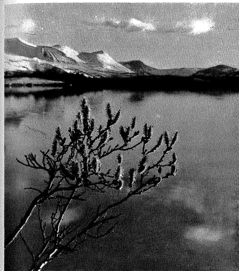
Videt — fjällnaturens största prydnad

Tänk bara på videt (vidjen), detta vidriga hinder för en vandrare, där man svär och sliter och inte kommer ur fläcken! Men ta er samman och se på denna växt utan marschhets i blodet: den torde vara fjällnaturens största prydnad. Detta vare sig man ser den som kollektiv eller individ. Den kläder in väldiga ytor i de läckraste grågröna färgtoner, den är som solitär vacker i byggnad, och hängena om våren är lysande guldgula — några färgstarka stänk, som Flora sparar till de översta regionerna mot den ständiga vintern.