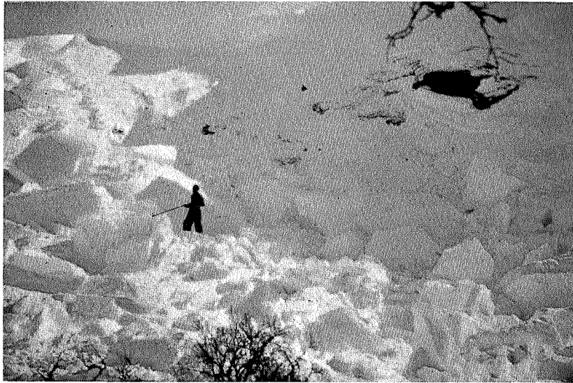
Snøras i Bymarka