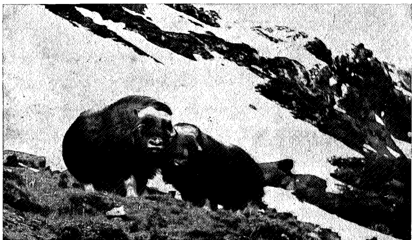
Dit — og ikke lenger!