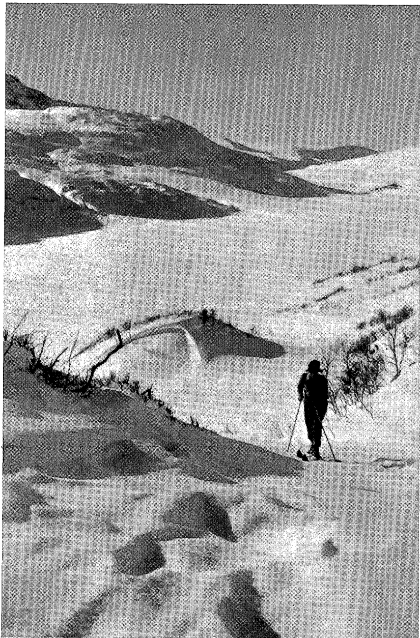
Fra Tovatn, Trollheimen.