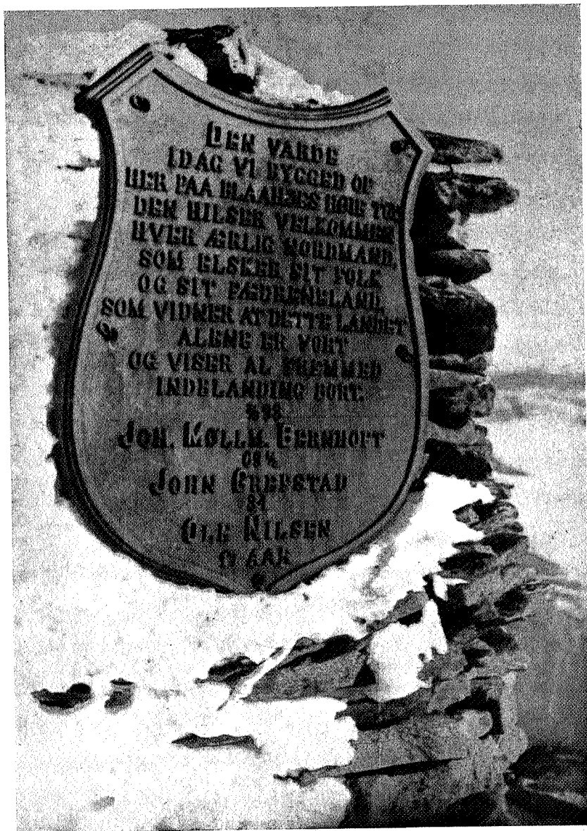
Jerntavla på Blåhø