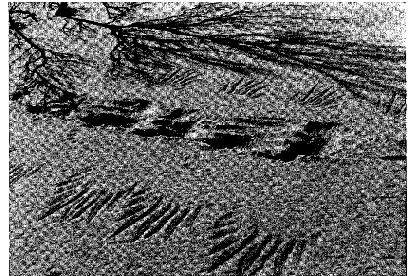
Hauk og hare

For noen timer siden trasket vi i gatesøla, og nå er vi oppe på fjellet. Overgangen er nesten overveldende og gjør oss sterkt mottagelige for de nye inntrykk. Aprilsola lyser over snøvidda og den kvite flata brytes bare av enslige fjellbjørk og av svarte knauser oppe i Gynillfjellet. Vi synes at haren aldri har satt så elegante spor etter seg i nysnøen, eller rypa laget slike runer på sin ferd mellom bjørkekjerrene for å plukke knopp, eller musa brodert så lekre kniplingsborder bortover snøen. Det går et friskt pust over vidda etter kuldegradene om natta, og det egger lysten til å fort-