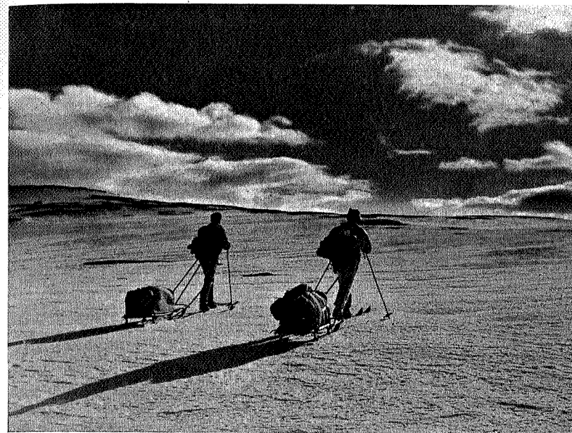
Oppe på vidda

Vi måtte jekke oss opp litt nå etter «daffingen» i bygda. Bare vi ikke hadde spist så mye! Og sola stekte, kjelkene kjentes tyngre uten vei eller spor. Jeg påstår at svetten sprutet horisontalt ut av ansiktet, og øktene ble ikke et sekund lenger enn fastlagt. Men etter