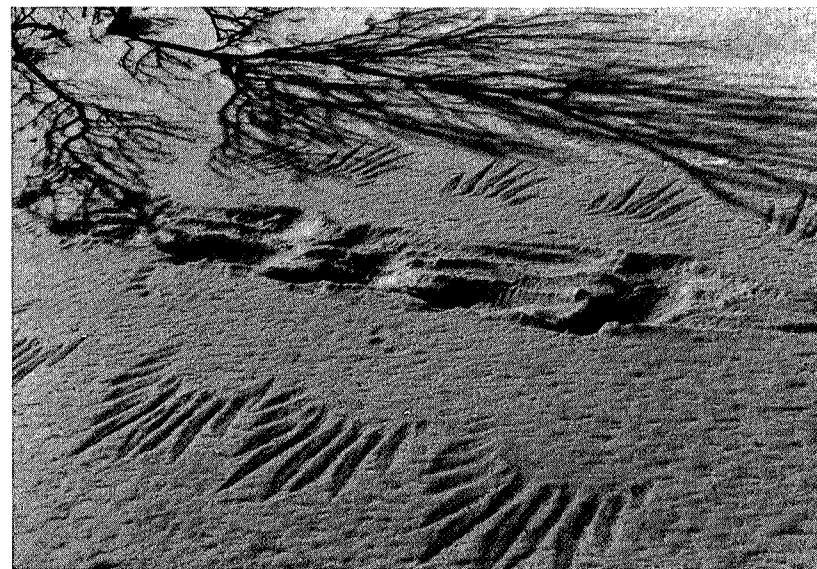
Hauk og hare

For noen timer siden trasket vi i gatesøla, og nå er vi oppe på fjellet. Overgangen er nesten overveldende og gjør oss sterkt mottagelige for de nye inntrykk. Aprilsola lyser over snøvidda og den kvite flata brytes bare av enslige fjellbjørk og av svarte knauser oppe i Gynillfjellet. Vi synes at haren aldri har satt så elegante spor etter seg i nysnøen, eller rypa laget slike runer på sin ferd mellom bjørkekjerrene for å plukke knopp, eller musa brodert så lekre kniplingsborder bortover snøen. Det går et friskt pust over vidda etter kuldegradene om natta, og det egger lysten til å fort-