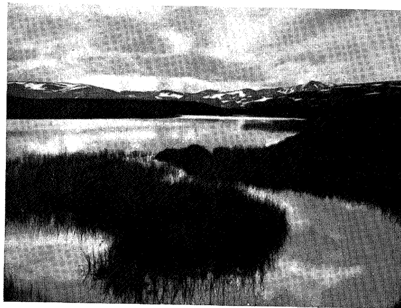
Tjønn ved Høgho.