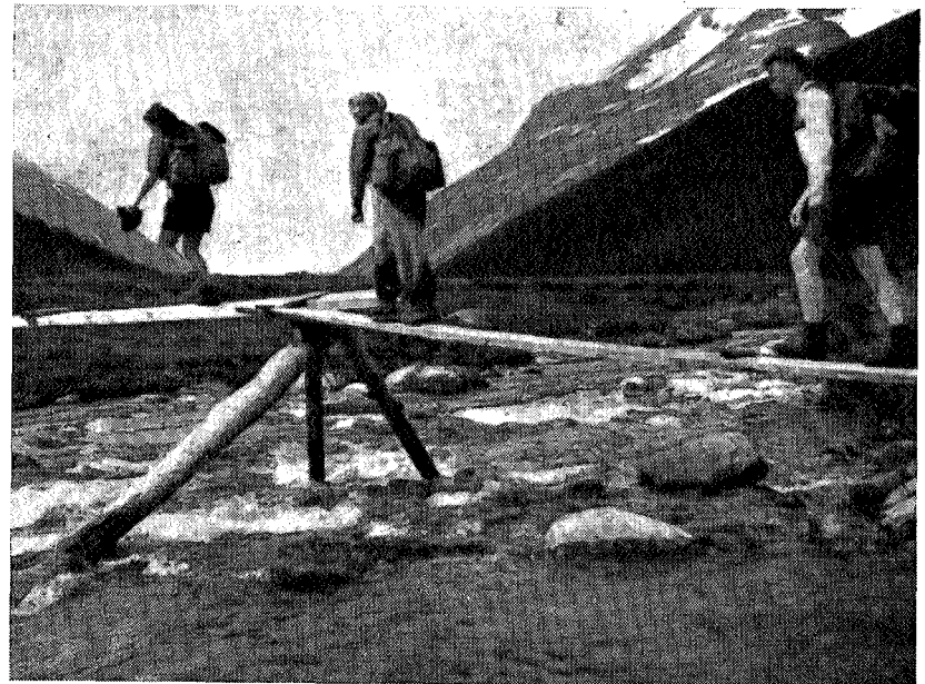
Svartåen ved Bruholtseter.