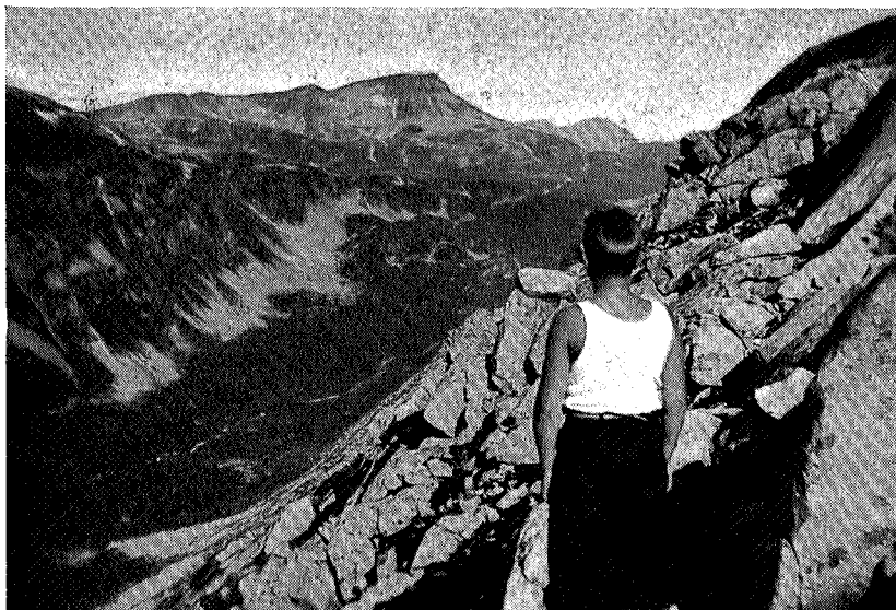
Romådalen mot Snota