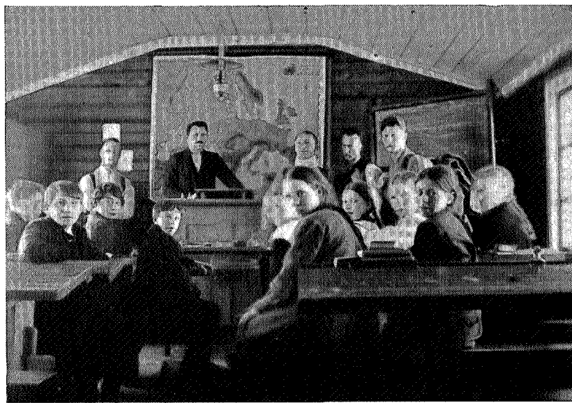
Skolestua i Stugudal