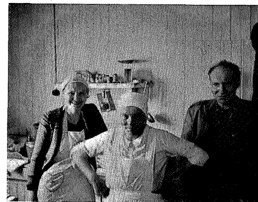
Vertskapet på Kjøli