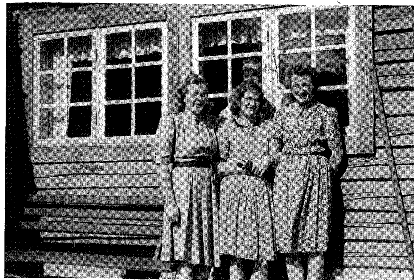
Betjeningen på Nedalshytta