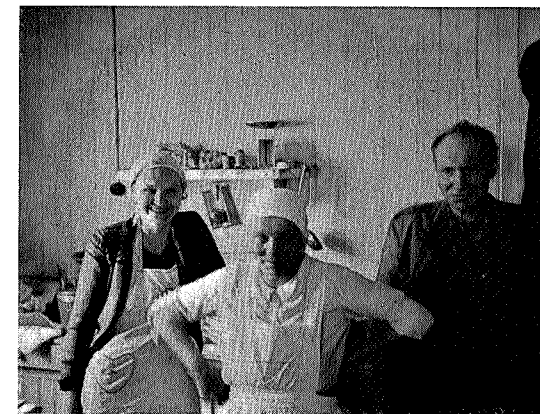
Vertskapet på Kjøli