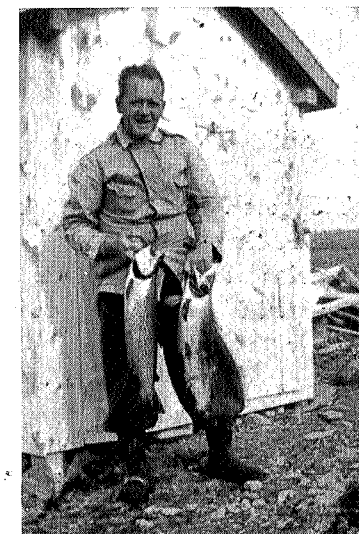
— og han som kom