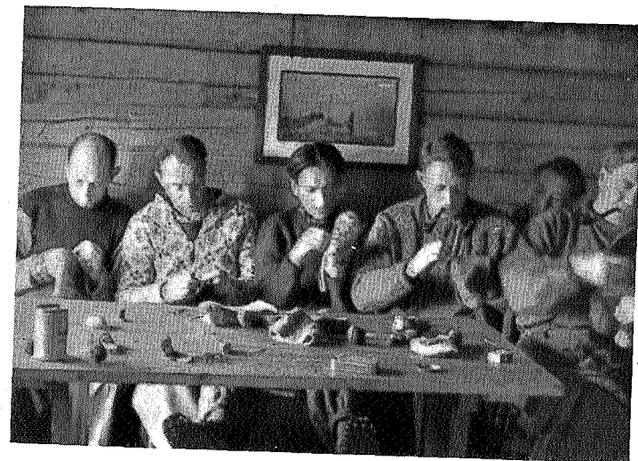
«Stoppsted» — Nedalen