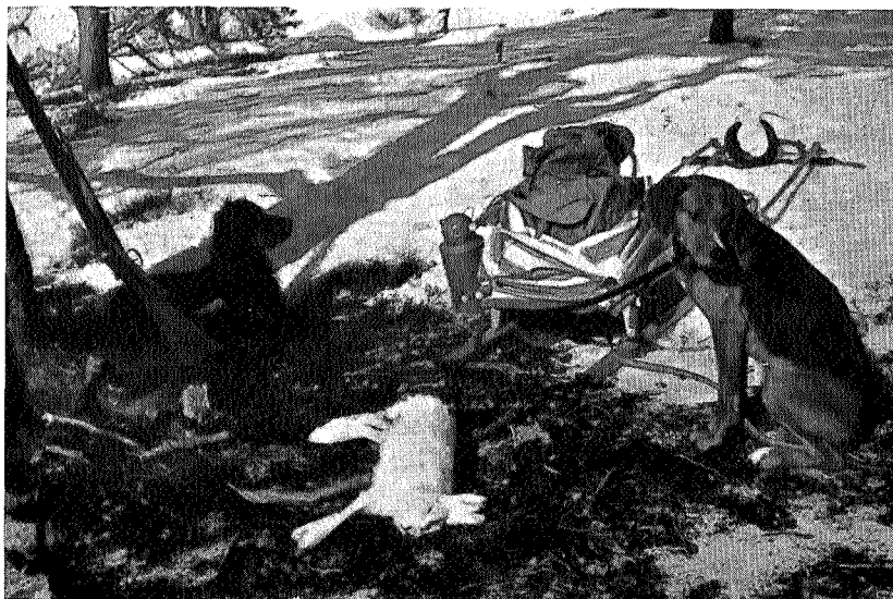
Vi kviler på