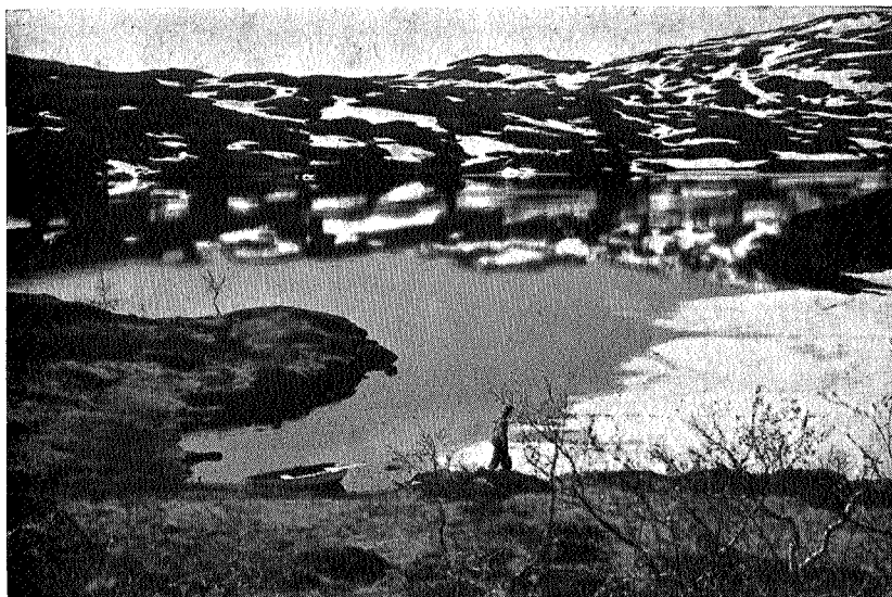
Vårdag austi Bringen