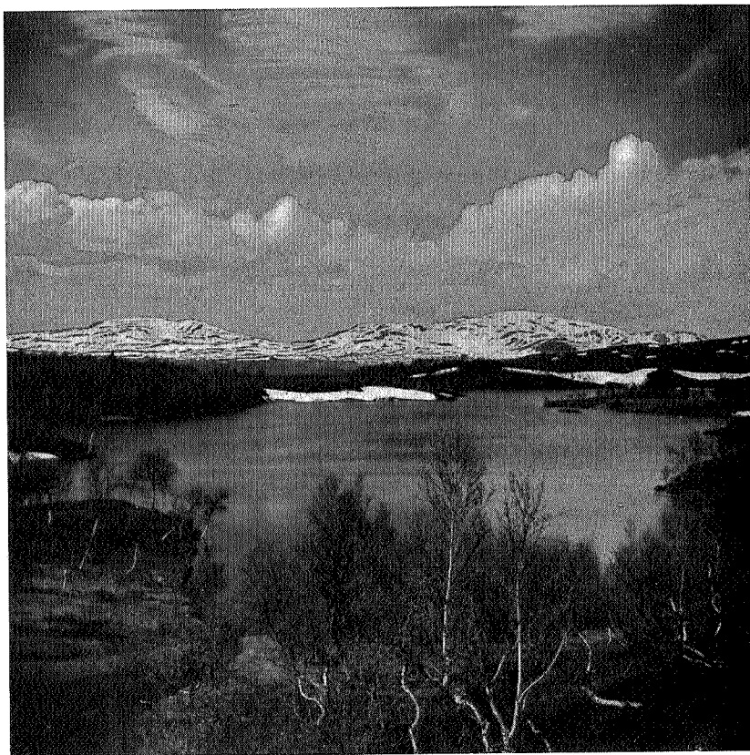
Ruten (tilv.) og Fongen (tilh.) fra øst