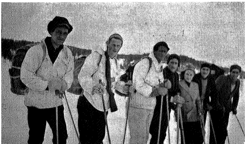
Kurerer og flyktinger på Stormoen