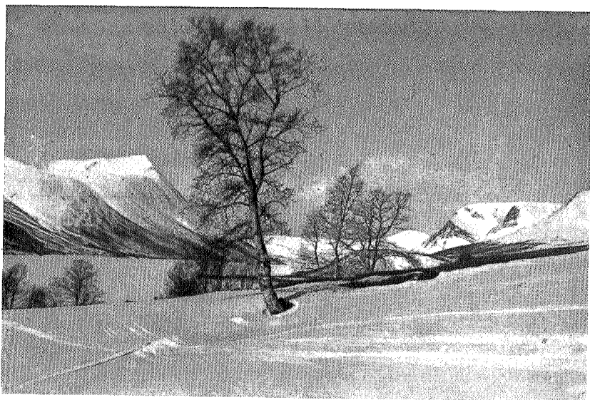
Gjevilvatnet med Okla og Kamm'an