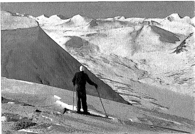
Fra Okla mot Vassenden og Neådalssnota