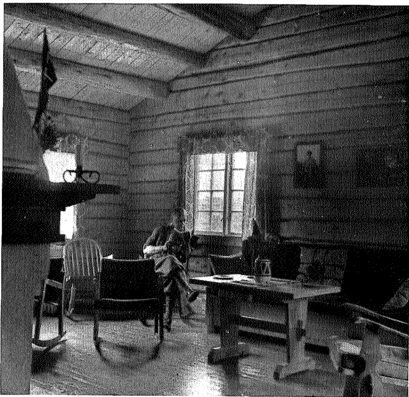
Peisestua på Schulzhytta