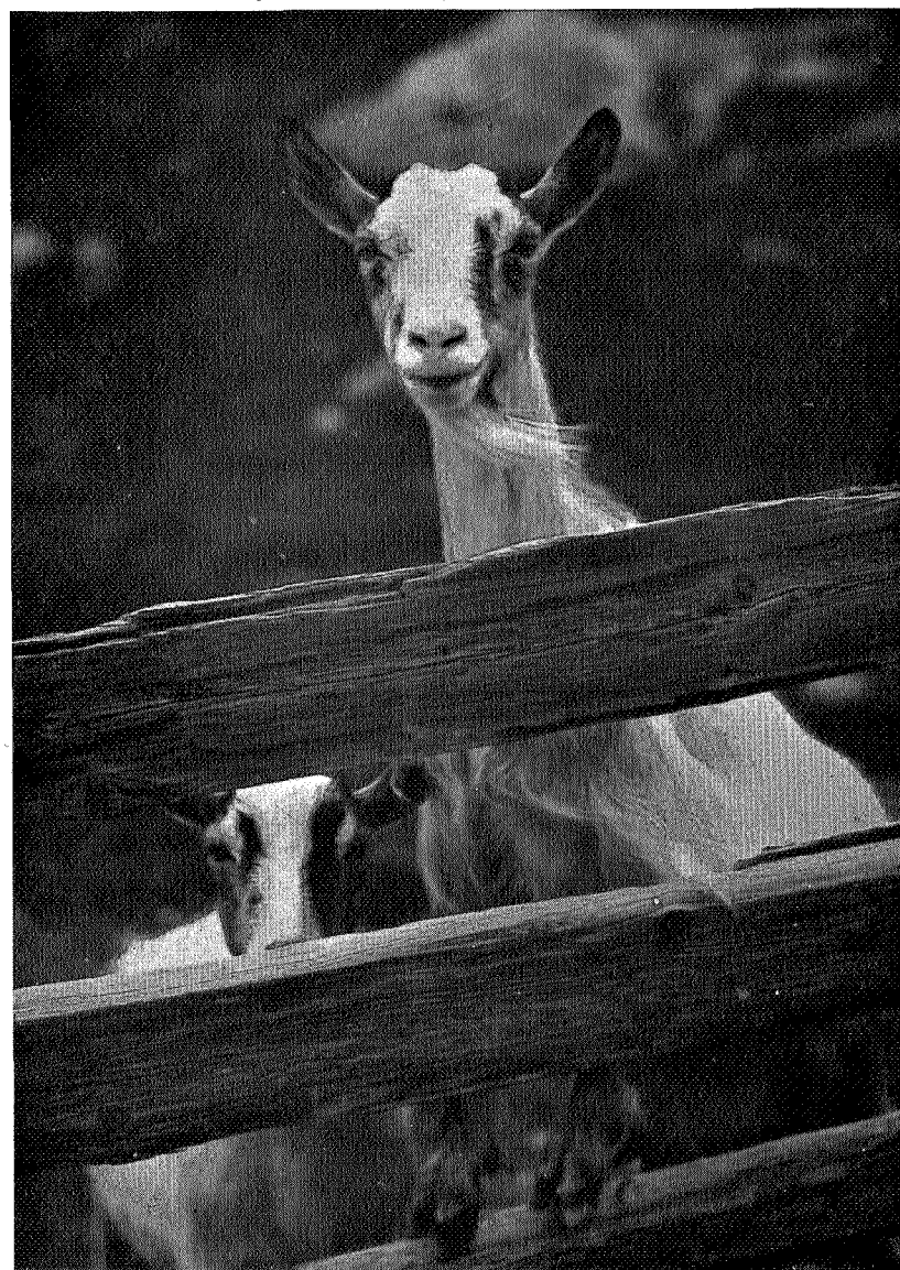
Bare ei lita klype til!