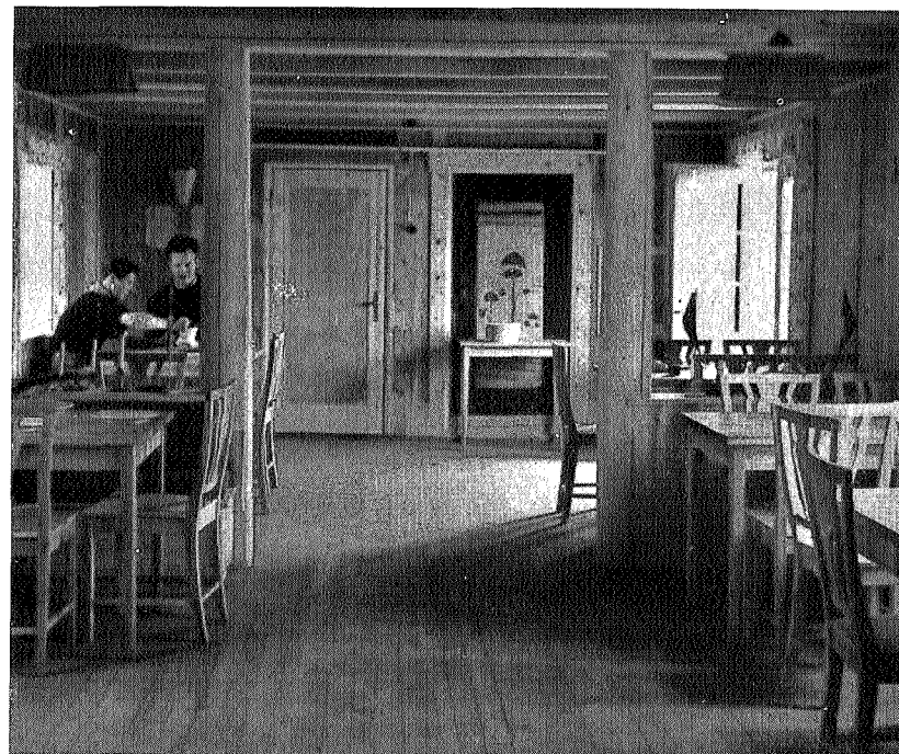
Spisestua på «Nordpå»

Aunegrenna er en koselig og usedvanlig vakker fjellbygd, øst for Gauldalen. Fra Haltdalen stasjon klatrer bilveg oppover dalsiden og vi får et praktfullt panorama over den vide og veldyrkede bygda i Haltdalen. Etter en halv times marsj er vi oppe på Kjølen, og snart ligger Aunegrennas grønne lier med koselig, gammel bebyggelse foran oss. Øverst oppe i skogbannet lyser Nordpå oss i møte med sine gamle, barkede tømmervegger og sitt nye, rødmalte panel. Utsynet fra Nordpå er fritt og fagert, Hulta renner rolig og idyllisk mellom bjørk og vidjer, grønne voller breier seg ut på sidene, de brune furuveggene i de gamle gårdene skinner som bronse i kveldsolen, og oppover lia slåss gran og furu med bjørka om plassen. Like nordenfor fosser Tverråa ned fra fjellet i avvekslende og idyllisk dalsøkk, og en attraksjon for stedet er en skålformet kulp med