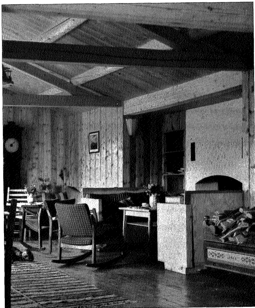
Peisestua på «Nordpå»