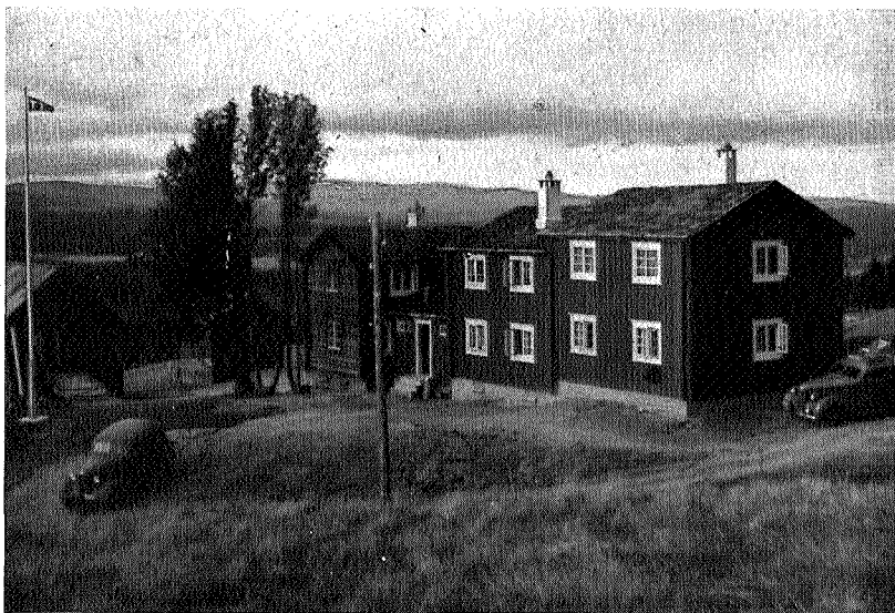
«Nordpå» fra nordøst