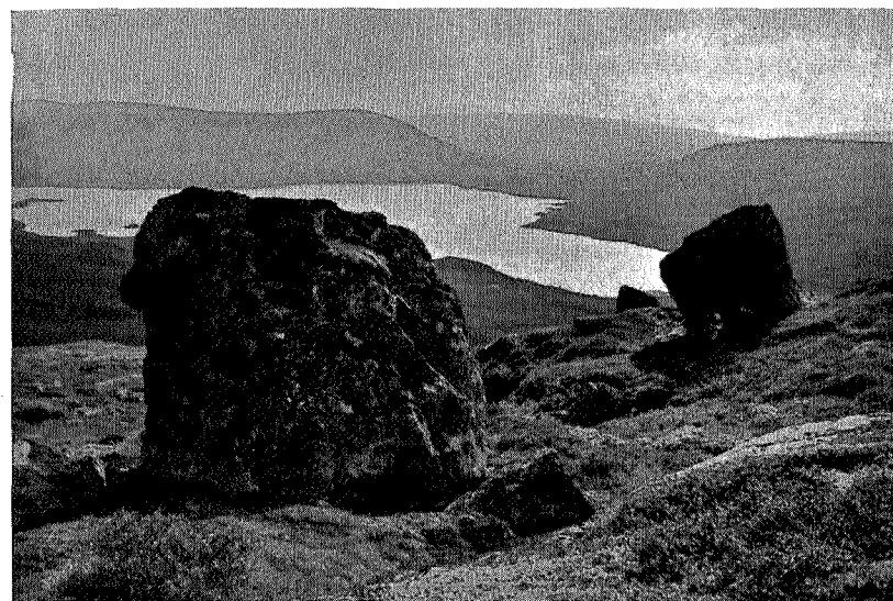
Fra Øiongen i Ålen.

stenen bakenfor gir balanse på motsatt side, samtidig som den leder blikket innover i bildet. Mennesker eller dyr kan med fordel brukes som staffasje i landskapsbilder; de må da ikke dominere slik at de trekker oppmerksomheten for meget vekk fra landskapet, og fremfor alt ikke være optatt av kameraet. Slik staffasje kan ofte også tjene som målestokk, som f. eks. i bildet «Utsikt mot Forellhogna»; her vilde en ikke få det rette begrep om rullestenens dimensjoner hvis en ikke hadde noget å sammenligne med; det kan også her være verd å legge merke til at stenen ikke er plassert midt i bildet.