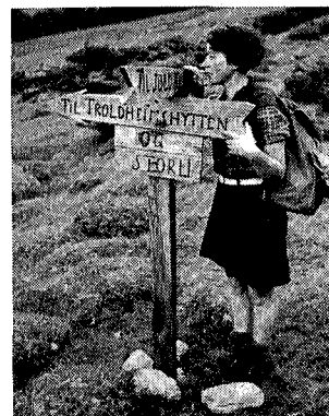
Si mig hvor veien går.