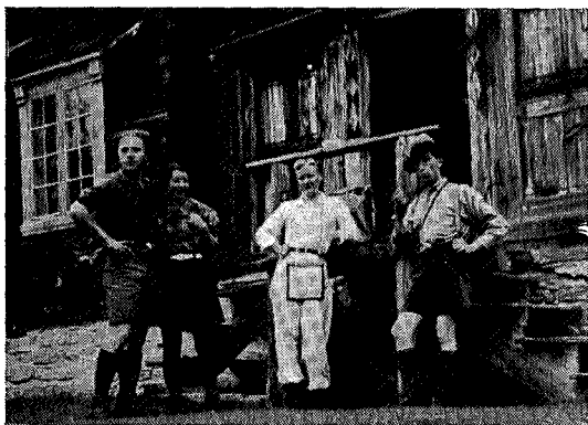
Østlendingene som var på tokt i Trollheimen. Forfatteren lengst til venstre.

Hvorefter vi forsvant via Reitan, Jensåsvoll og Stugudalen til Skardørsfjellene og Sylene, men det kan kanskje være gjenstand for en senere beskrivelse.