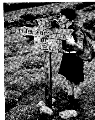
Si mig hvor veien går.