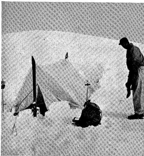
Leiren i 1900 m. høide.

Nå, vi var da ute og rekognoserte, skremte op en masse ryper som satt rundt oss på alle kanter og kurtiserte høilydt, og