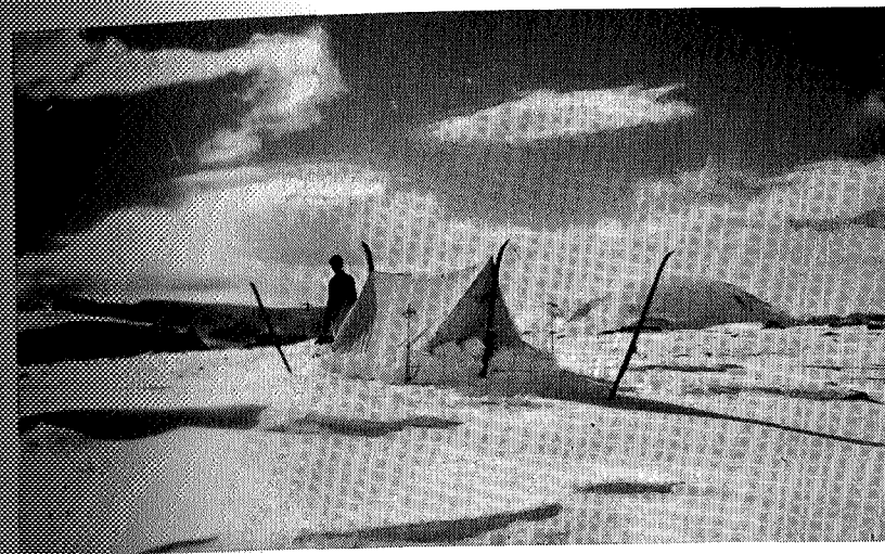
Utsikt mot Smørstabbene.

«Husker du føika ifjor, da vi startet for Jostedals-