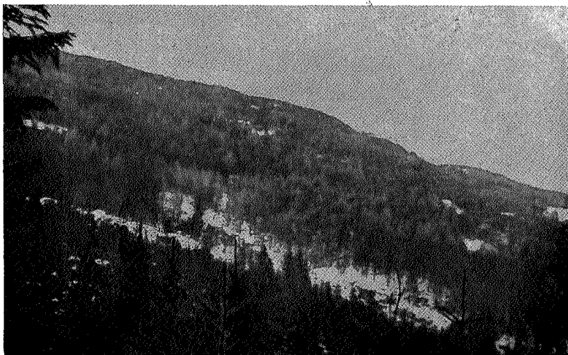
Ilsvikbergene fotografert 1921.

Andragendet blev på det varmeste anbefalt av magistraten og bifalt av formannskapet den 5. oktober 1871.