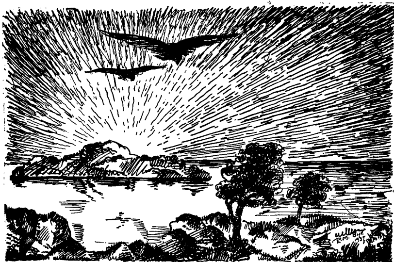
Da de skrudde sig op gjennom luften, møtte de solen — —

Da de imorges skrudde sig op gjennom luften møtte de solen som nettop flommet inn over fjellene i øst. De seilet derefter solbelyst i stor høide i stadig videre cirkler og speidet efter et eller annet som kunde være passende som mat nu på morran. —