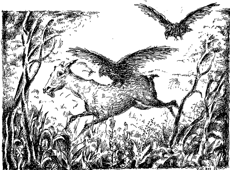
Som et skred slår hunørna ned over kolla — —

Inne ved vatnet støkker de en hjortekolle som i strakt trav tar veien innover mot det sted hvor ørnene hviler. Ørnene får øie på dyret idet det kommer ut av skogen for å passere over en myr nedenfor det sted hvor de sitter.