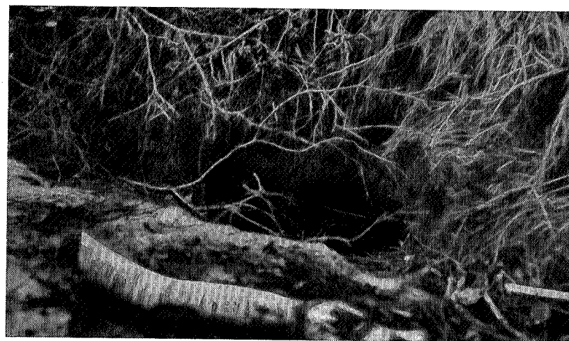
Inngang til beverhule ved Grytdalselven.

Den drog imidlertid snart ut på rekognosering. Man kunde følge den fra vann til vann, og langs vassdragene, inntil den tilslutt tok opphold ved Grytdalselven ca. 5 km. fra Åmodtjernet, hvor den blev utsatt. Den bygget ikke hytter der, men gravet sig inn i elvebredden på flere steder. Senere er den flyttet lengere ned i dalen til Auset, hvor den fremdeles holder til.