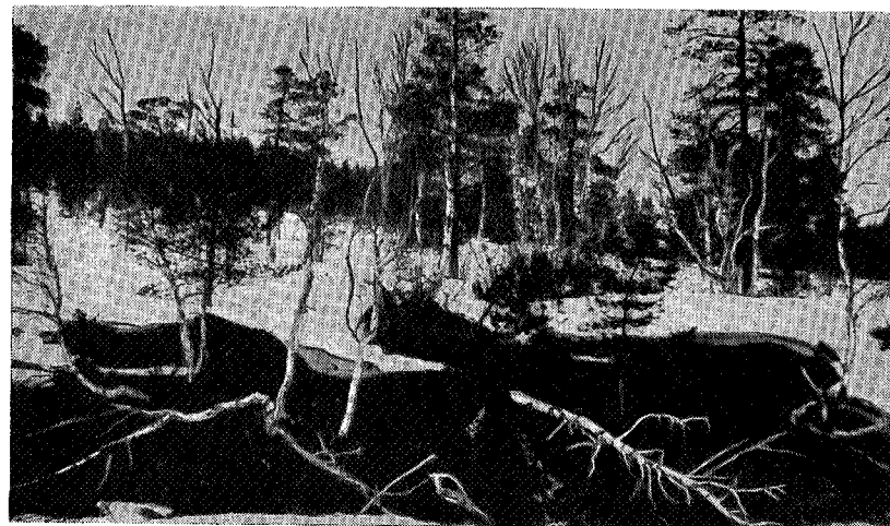
Bjork felt av beveren i Grytdalen.

Det er fred og eventyrstemning i denne store naturpark. Kronhjorten skrider majestetisk frem langs tallrike optråkkede stier