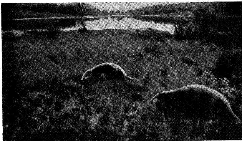
Bever ved Amodtjernet.

ser ut til at dyrene trives, og i Grytdalen synes det nu å være en ganske stor beverstamme. Langs hele dalstrøket ser man spor etter dens virksomhet, idet man stadig treffer på nedfelte løvtrær med de for beveren så karakteristiske stubber.