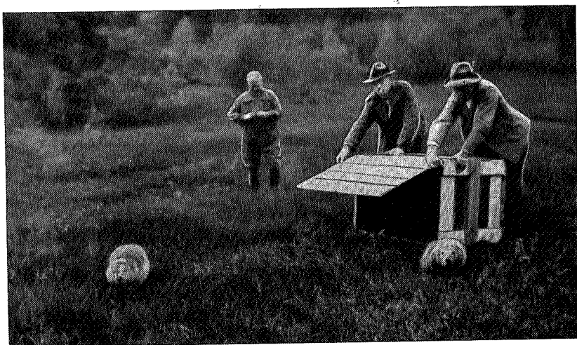
Beveren settes i frihet.

ca. 40 år, optrer i store mengder, så man trygt kan si at Sognli revier er blitt en viltreserve for tilstøtende distrikter.