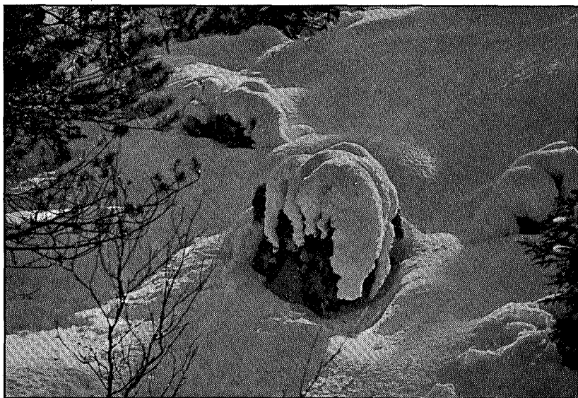
Snetroll i Bymarken.