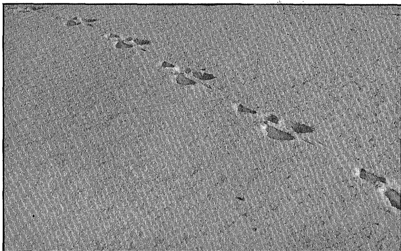
Harespor i Bymarken.