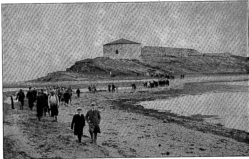
Fra høstturen 1933 til Steinviksholmen og Forbordfjellet.

skodde og regn blev snytt for den vakre og interessante utsikt som man har herfra. Ved tilbakekomsten til Fløan blev det kaffekoking og badning.