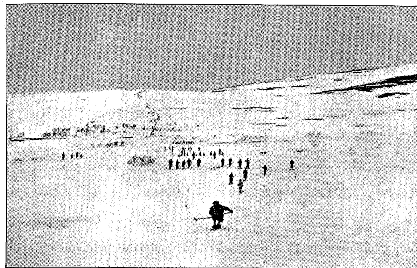
Fellestur Storlien—Meråker 30. april 1933.

Denne blev henlagt til Singsåsfjellene. Ruten gikk fra Kotsøy over Samsjøvola til Singsås.