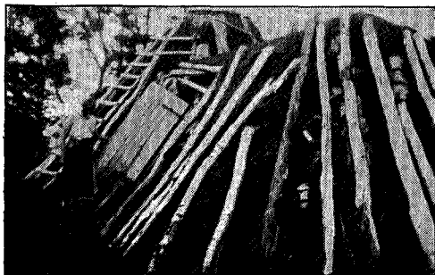
Gamme mellem Sved og Færsdalen.

at det var femte året døtrene var med. «Går dere virkelig om vinteren og med de to jentungan?» spurte konen nesten forskrekket. «Nei, om vinteren er jeg på kontor i byen», smålo far. «Ja, vi skjønt' da at De itj var fant», svarte datteren henes fort, og vi fikk melken og potetene.