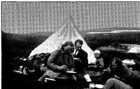
Frøkost ved Storkjerringvatnet.

Efterat vi fikk telt, har vi meget mere utbytte av turene våre. Vi er ikke lenger avhengig av veier eller nattelosji. Regelen er blitt at vi mest mulig