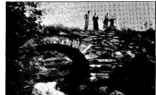
Gammel bro ved Skalstugan.