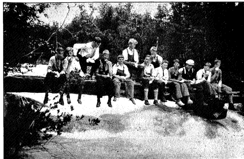
Fra planteturen til Trollheimen 1931.

Ved Jøldalshytta blev plantet 5000 furuplanter. Forsøksvis blev plan-