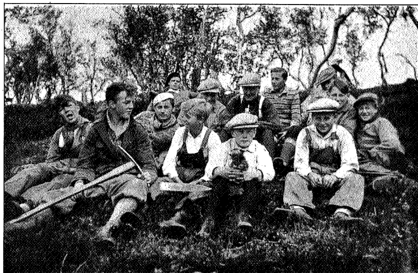
Deltagerne i planteturen til Trollheimen 1931.