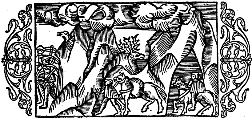
Fig. 1. Passasje over Skars- og Sylfjellene. Efter Olaus Magnus 1555.

Først i den yngre periode av stenalderen, da mennesket ved kjennskapen til kreaturhold og åkerbruk etterhånden blir mere stasjonært og samtidig finner vei opigjennem dalførene, da med andre ord innlandsbygdene blir befolket, finner vi kulturforhold som ikke bare forutsetter, men som også bevislig må ha trukket op virkelige ferdselsveier dels mellom de enkelte bygder, dels mellom større landsdeler som f. eks. mellom det østenfjelske og nordenfjelske og dels mellom de land som nu kalles Norge og Sverige. Av årsaker som er for spesielle til å gå inn på her, er der opstått en større bevegelighet folkene imellem, og der utvikler sig handelssamkvem med linjer som trær frem i stadig klarere relieff, efterhvert som det arkeologiske materiale vokser. Allerede stenalderens mennesker be-