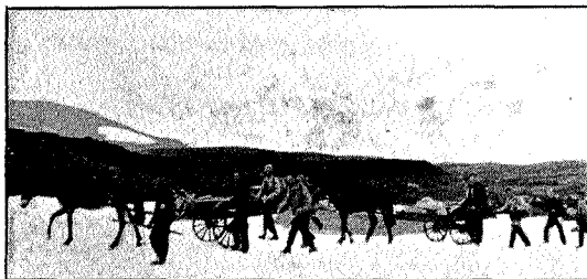
Over breene opunder Lauv-vola.

Fjerde marsjdag. Over Selbyggliene, helt innunder Lauv-vola. Et herlig utsyn mot vest til Fongen og Ruten. Vi er oppe i det vildeste og mest stor-slagne fjellparti i Trøndelagens østli-