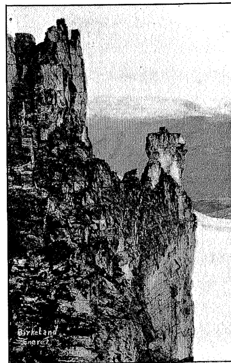
Nordklørne, Trolltindene.

Men vi slet oss da frem til Sheppards skar. Dette ser fra Norddryggen meget utilgjengelig ut. Eggen ned i skaret smalner av til noen få fots bredde, og situasjonen forverredes denne gang på grunn av sneen som lå nedover eggen og nede i skaret dannet en skavl, så her måtte der legges forankring mens den ene smøg sig forsiktig over til den annen side, hvor der reiste sig en utilgjengelig ca. 100 meter høi loddrett vegg. Men ved å traversere ut til venstre lykkedes det oss å omgå veggen. Vi befant oss på en hylle, som fortsetter nærmest som et galleri en 30 å 40 meter skrått opover. Der var lavt under hodet, så vi måtte nærmest krype på fire og være yderst forsiktig, da der var mye løst fjell. Her i skyggesiden var det temmelig kaldt; men snart