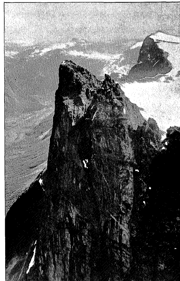
Trolltindene sett fra Store Trolltind. (Fot. Birkeland).

dyp, så det gikk godt; men vi var herefter litt mere forsiktige, og nådde Frokostplassen i god behold, pakket hurtig sammen og 3 timer senere var vi på Åndalsnesbåten som skulde føre oss tilbake til Molde. Og mens vi stod der ved rekken og betraktet fjellene, gled månen frem mellom Vengetindene og Romsdalshorn og kastet et spøkelsesaktig skjær over Trolltindene.